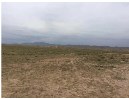
已种植的人工牧草场