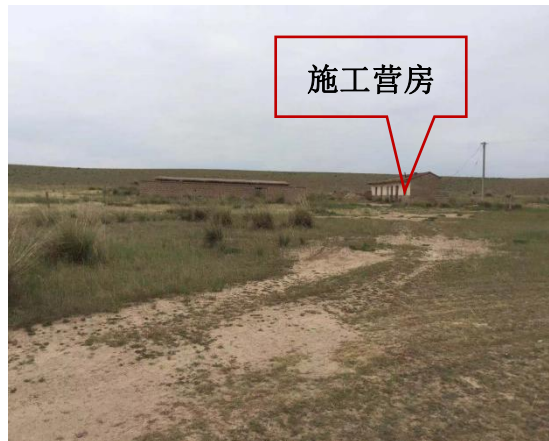
施工营地租用达隆养鸡场废弃厂房