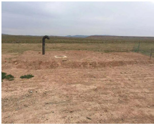
一级泵站前池 (100m 3 )