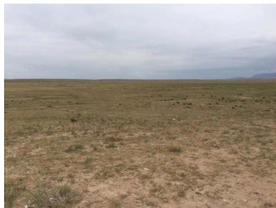
已种植的人工牧草场