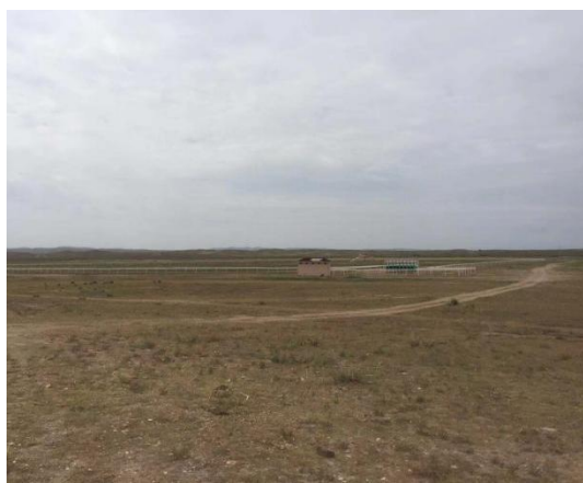
已种植的人工牧草场