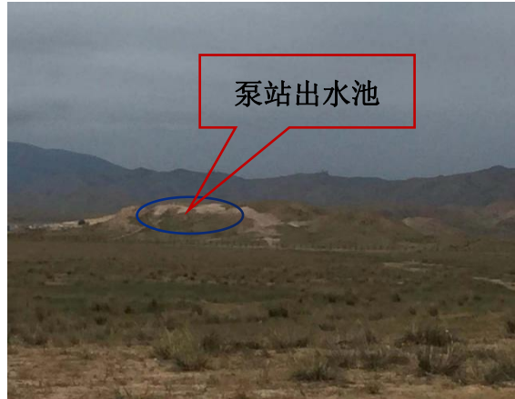
泵站出水池 (300m 3 )